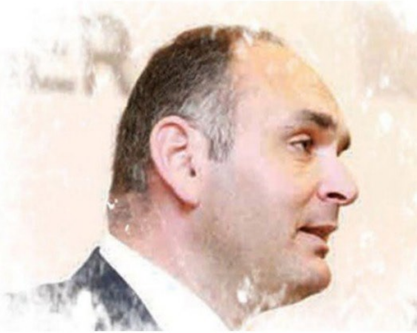
«هايد بارك» تخطط للقيود بالبورصة 2017 swxbt

منذ 24 ساعة 0 تعليق 1 إرسال لصديق نسخة للطباعة